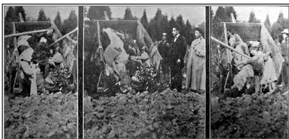
Figura 1. Fosa común, Cementerio Bogotá. La carreta macabra.

Igualmente, los informes oficiales hablan de una “triste insipiente de nuestra higiene pública merced a la cual pueden reputarse como un milagro la existencia normal de la ciudad, con sus calles llenas de lodo o de polvo (...) y sobre todo esto, la miseria y el supremo desaseo en que viven las clases bajas del obrerismo” (30) (figura 1).