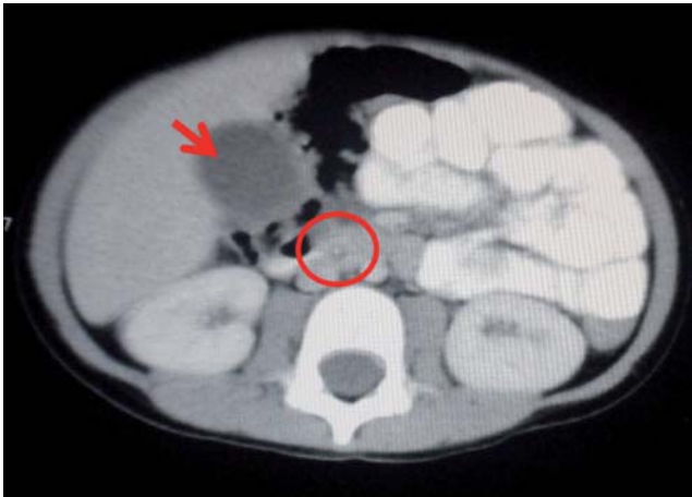
Figura 3 Tomografía axial computarizada abdominal donde se evidencia dilatación de la vesícula biliar y edema de la pared (flecha) y dilatación del colédoco con cálculo de 3 mm en su interior (círculo).

Cuando se presenta pseudocoliclitiasis asociada al uso de ceftriaxona, la mayoría de los casos cursan como asintomáticos 13 o mínimamente sintomáticos 19 y de resolución espontánea, solo al suspender el uso del fármaco 6,11-13 ; sin embargo, existen reportes en la literatura de cuadros tan severos como colecistitis necrozante 20 . Un estudio prospectivo realizado en Turquía 9 mostró en 38 pacientes a quienes se administró ceftriaxona a dosis de 100 mg/kg/día, anomalías ecográficas en la vesícula en 14 (36,8%), siendo el hallazgo más frecuente la coliclitiasis (11 casos); solo 1 caso presentó sintomatología sugestiva 9 . En este mismo país, e igualmente de forma prospectiva, se evaluaron 118 niños que recibieron ceftriaxona, encontrando pseudocoliclitiasis en el 17% de ellos 13 . Otra investigación prospectiva evaluó a 44 niños,