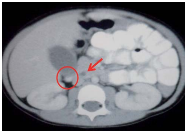
Figura 4 Tomografía axial computarizada abdominal donde se evidencia dilatación proximal del colédoco (flecha) y un cúmulo de microcálculos en zona declive de la vesícula biliar (círculo) dilatada con engrosamiento de sus paredes.