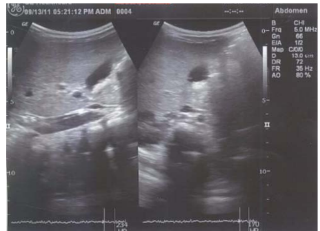
Figura 1 Ecografía de la vesícula biliar el día 5 de tratamiento con ceftriaxona, donde se observa cálculo en su interior.

axial computarizada abdominal, donde se confirman signos de colecistitis con dilatación del colédoco y un cálculo de 3 mm en su interior (figs. 3 y 4). Se considera cuadro de coledocolitiasis y colangitis (fiebre y obstrucción de la vía biliar) asociado al uso de ceftriaxona, se inicia manejo antibiótico con ampicilina/sulbactam y se considera el manejo quirúrgico. Se toma control ecográfico a las 24 h, donde se evidencia microcálculos en la vesícula, sin cálculos a nivel de colédoco; por lo anterior, se contemporiza el manejo quirúrgico; cinco días después, la colangiografía muestra colelitiasis sin cole-